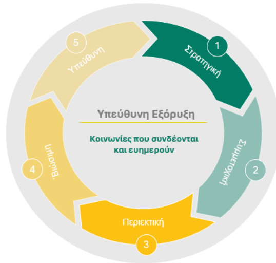
Σχήμα 2: Κατευθυντήριες αρχές της Eldorado Gold για την ανάπτυξη της κοινωνίας

1. Η προσέγγιση πρέπει να είναι στρατηγική. Πρέπει να συνδέει τις δραστηριότητες και τις επενδύσεις με τους βραχυπρόθεσμους και μακροπρόθεσμους εταιρικούς στόχους, τις εξελισσόμενες προτεραιότητες της κοινωνίας και πρέπει να είναι συντονισμένη με τις υπάρχουσες δραστηριότητες και πρακτικές για να προσφέρει το μεγαλύτερο όφελος για τις κοινωνίες.