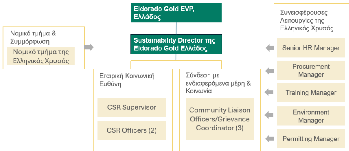
Σχήμα 1: Οργανόγραμμα για την υλοποίηση του CDP